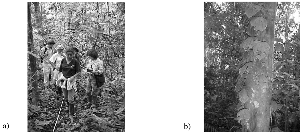
Figura 1. a) Establecimiento del transecto de 500 metros para la evaluación botánica, b) Clidemia epiphytica (Melastomataceae), una especie trepadora, encontrada principalmente en los hábitats con suelos arcillosos denominados aquí “Pebas” y “Supaychacra”.

Colectamos un ejemplar de todas las especies de melastomatáceas dentro de los transectos, y registramos el número de individuos por especie. Asimismo, colectamos individuos cuya identificación en el campo quedó incierta. Las muestras colectadas están depositadas en el Herbarium Amazonense (AMAZ) de la Universidad Nacional de la Amazonía Peruana (UNAP).